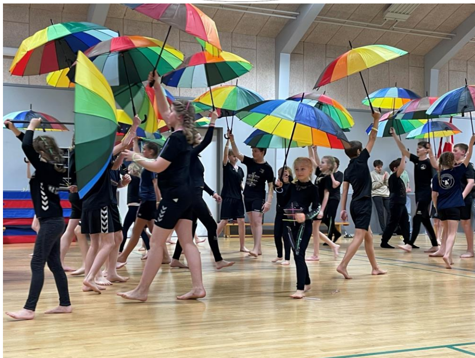
Gymnastikopvisning ved Hover-Torsted Friskole