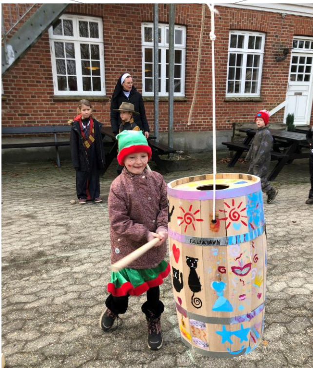
Fastelavn på Friskolen